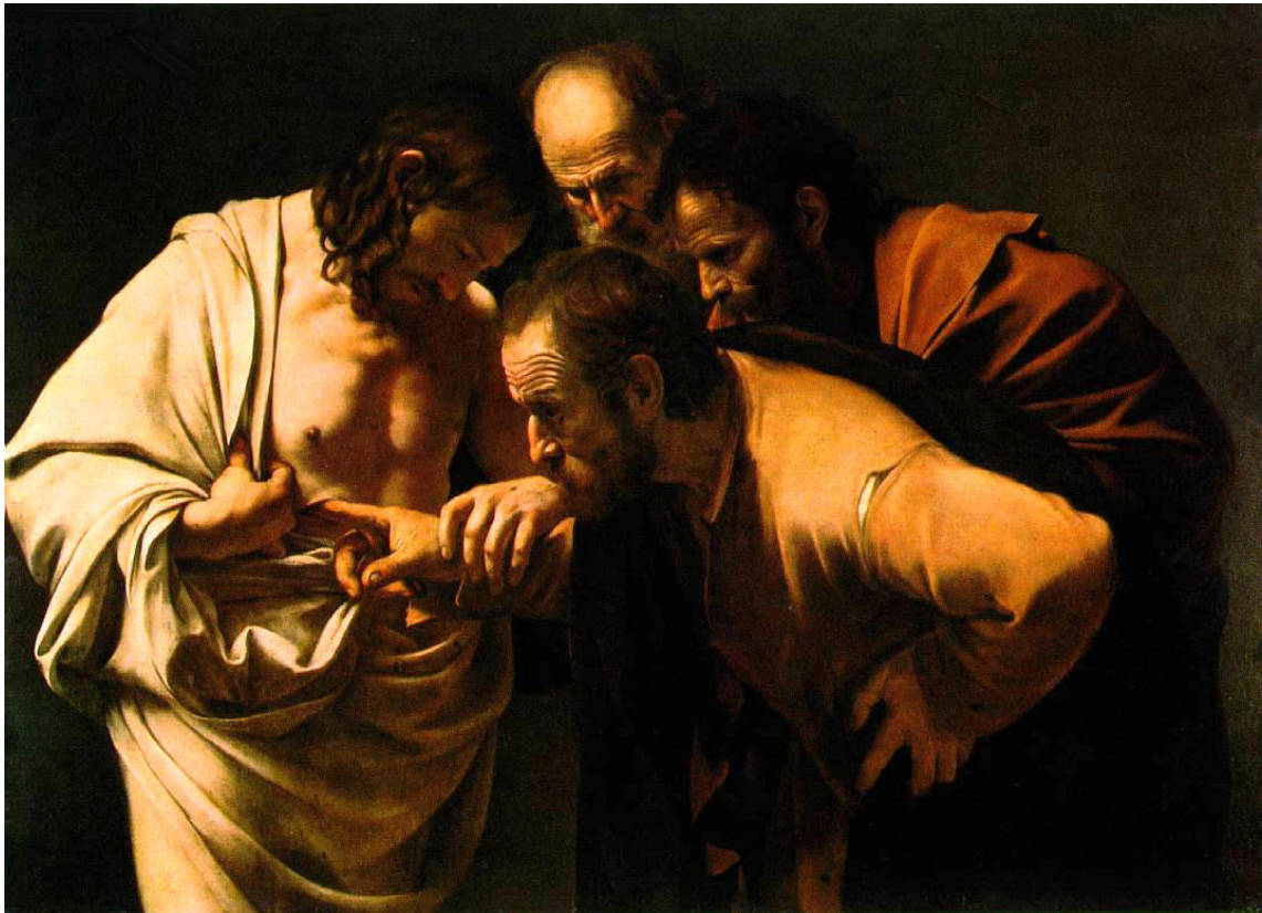
Der ungläubige Thomas